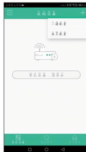
4. 点击右上角的 "+" 选择 一键配置