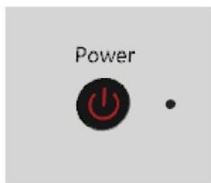
2. 长按电源键 5 秒以上