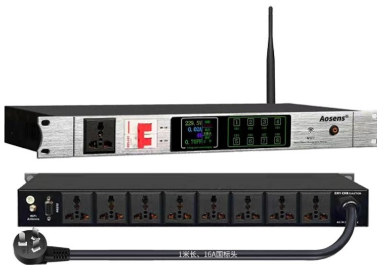
AS-APX4-M9YRW (2P 空开)