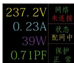
3. TFT 彩屏显示配网中