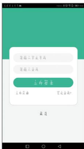
1. 打开并登陆 APP